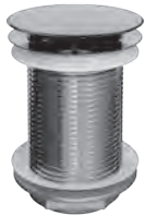
Zwangsablauf als Zwangsablauf für Waschtische ohne integrierten Überlauf