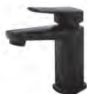
Einhebelmischer Schwarz Matt inkl. Push-Open Ablaufgarnitur

Zugstange für herkömmliche Ablaufgarnituren/Clou-Überlaufsysteme ist im Lieferumfang enthalten!