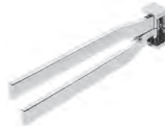
Handtuchhalter Chrom Glanz, zur Wandmontage, 2-armig Mindestplatzbedarf: 120 mm