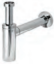
Design-Ablauf-Garnitur Chrom Glanz