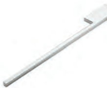
Handtuchhalter Chrom Glanz zur Korpusmontage, 1-armig Mindestplatzbedarf: 120 mm