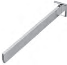
Handtuchhalter Chrom Glanz, zur Wandmontage, 1-armig Mindestplatzbedarf: 120 mm