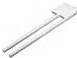
Handtuchhalter Chrom Glanz zur Korpusmontage, 2-armig Mindestplatzbedarf: 150 mm