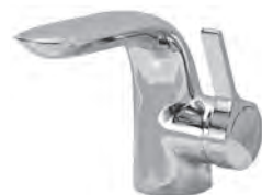
Einhebelmischer Chrom Glanz Ideal Standard

Zugstange für herkömmliche Ablaufgarnituren/Clou-Überlaufsysteme ist im Lieferumfang enthalten!