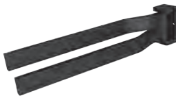
Handtuchhalter Schwarz Matt zur Wandmontage, 2-armig Mindestplatzbedarf: 120 mm