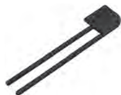
Handtuchhalter Schwarz Matt zur Korpusmontage 2-armig Mindestplatzbedarf: 150 mm