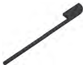
Handtuchhalter Schwarz Matt zur Korpusmontage 1-armig Mindestplatzbedarf: 120 mm