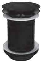
Zwangsablauf Schwarz Matt als Zwangsablauf für Waschtische ohne integrierten Überlauf