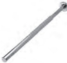
Handtuchhalter zur Wandmontage, 1-armig, ausziehbar, Chrom Glanz Mindestplatzbedarf: 80 mm